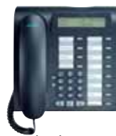
optiPoint 500 standard